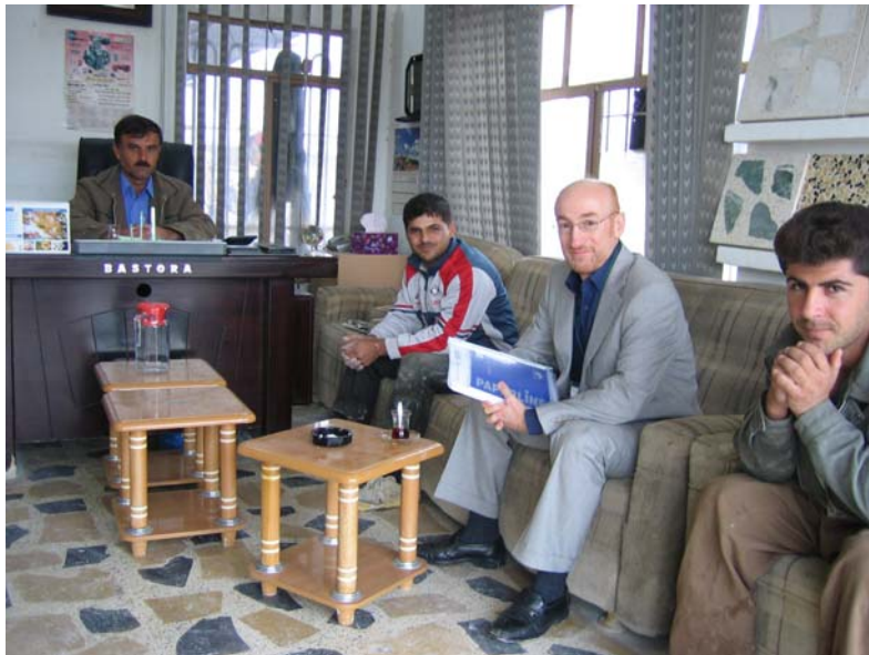
Vermittlung in Arbeit, Erbil, Irak