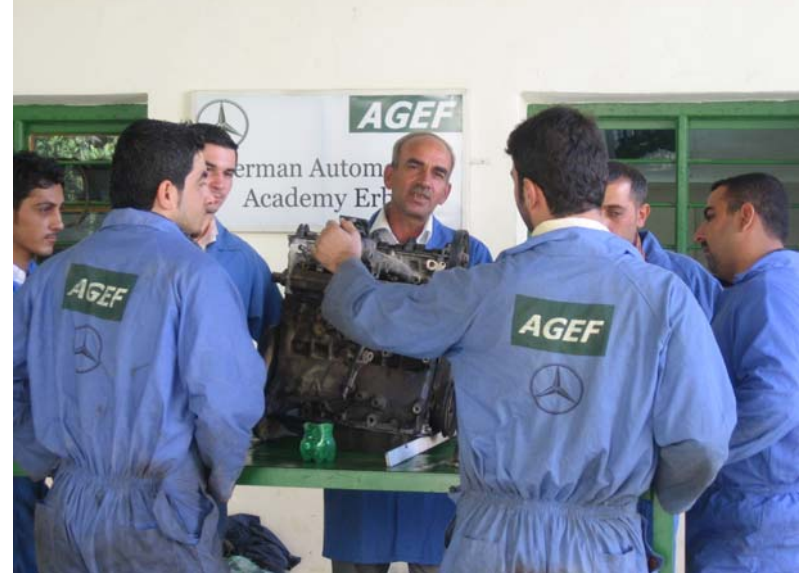
Kfz-Mechaniker-Ausbildung Erbil, Irak