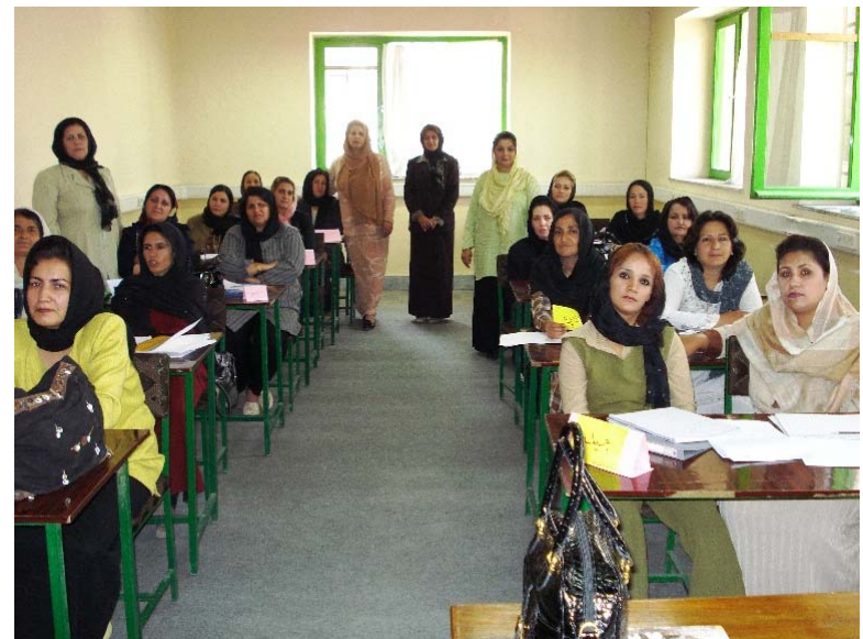
Weiterbildung Kindergärtnerinnen, Kabul, Afghanistan