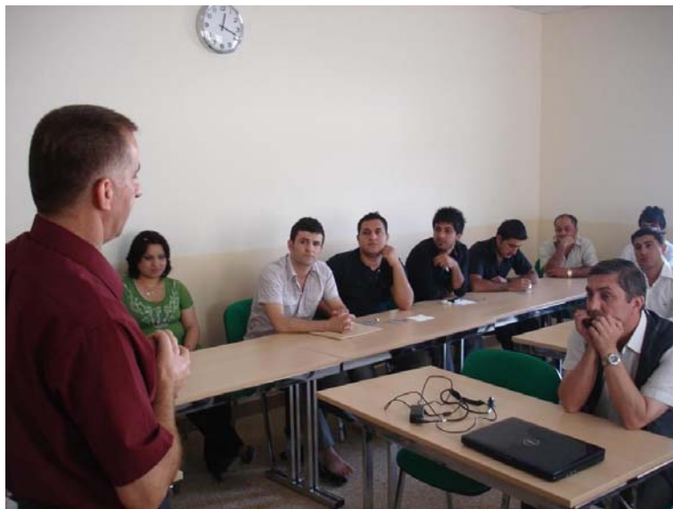
Orientierungsseminar Erbil, Irak